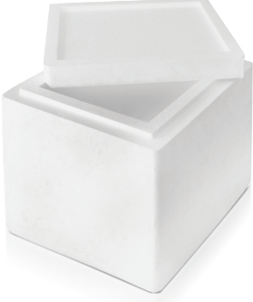
Medikal Kutu / Medical Box

Enjeksiyon hattında farklı kalıplarla üretilen ürünlerden örnekler