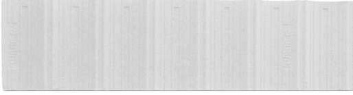
Metal Kiremit Altı Levhası / Metal Tile Tray