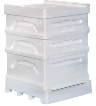
Arı Kovanı / Bee Hive