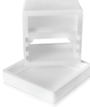
Ana Arı Kutusu / Bee Box