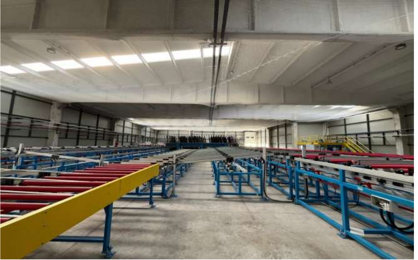
Resim 1- Yeni fabrikadan görünüm