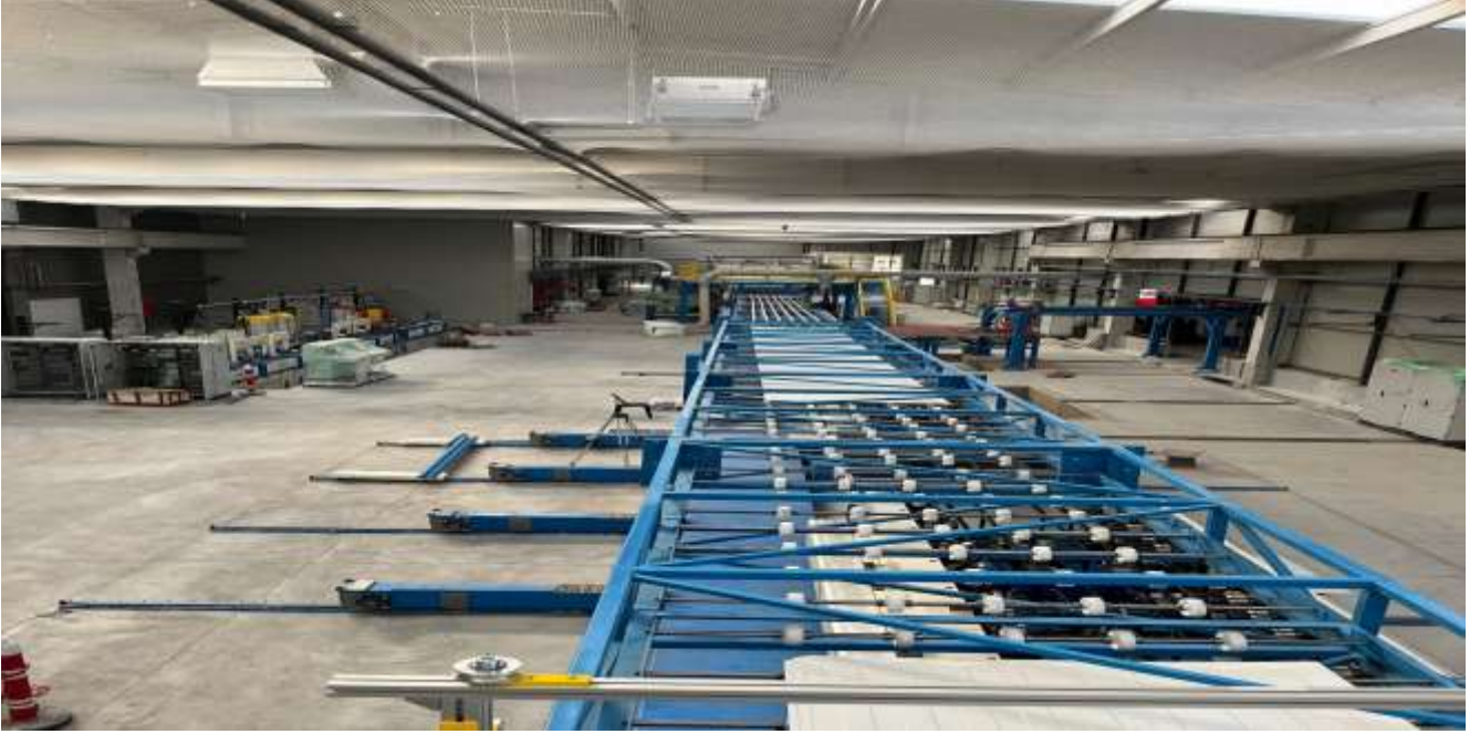
Resim 3-Yeni fabrikadan görünüm