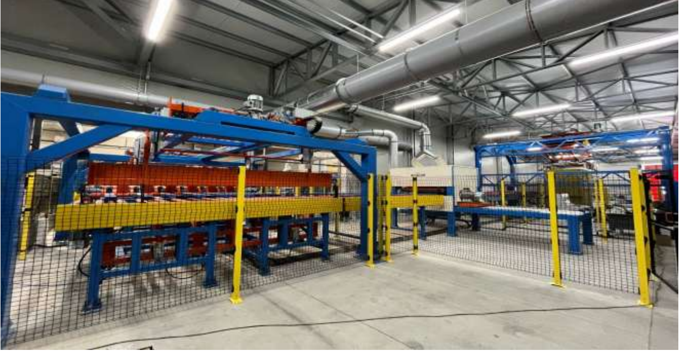
Resim 5-Yeni fabrikadan görünüm