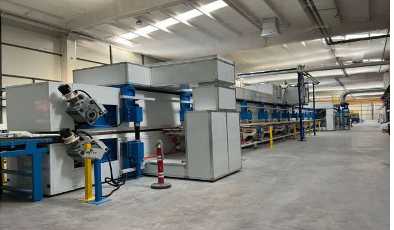
Resim 6-Yeni fabrikadan görünüm