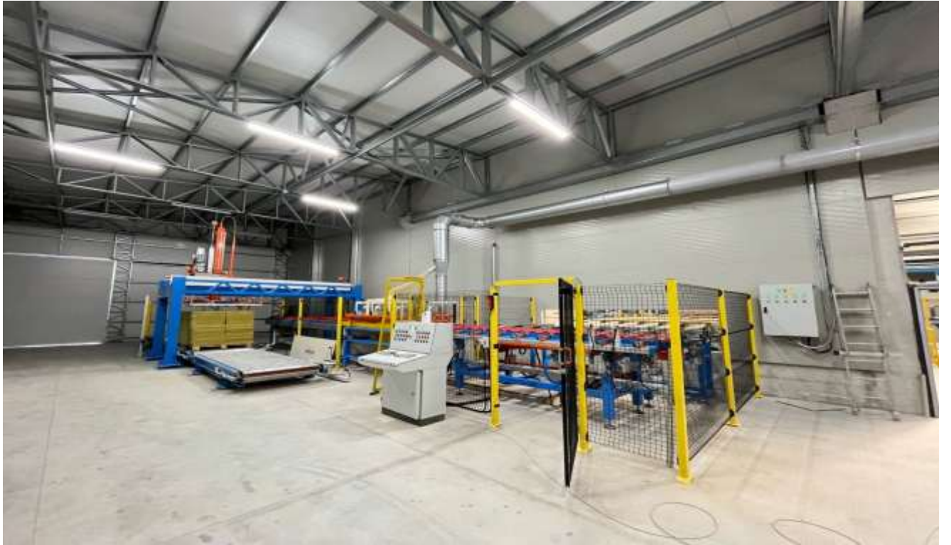
Resim 2- Yeni fabrikadan görünüm