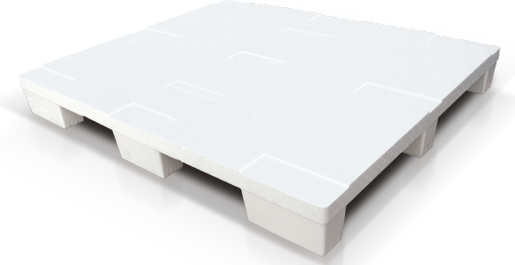
Taşıma Paletleri / Pallets 80x120 - 100x120 cm