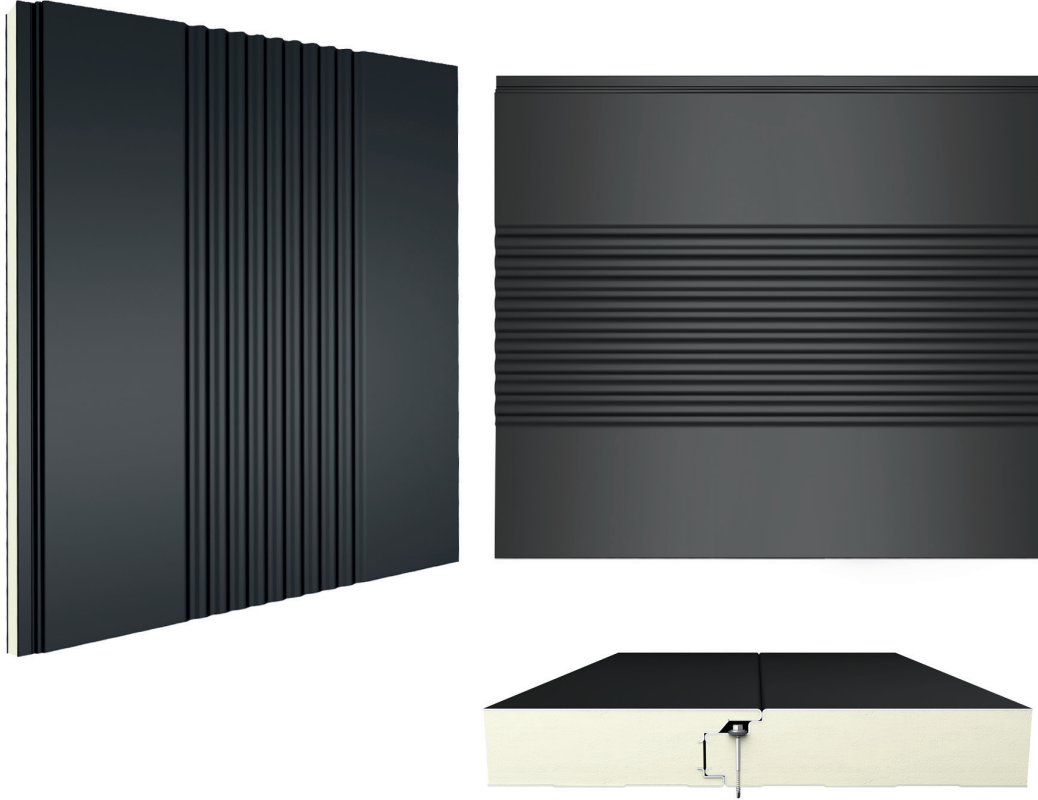
Birleşim Detayı / Connection Detail